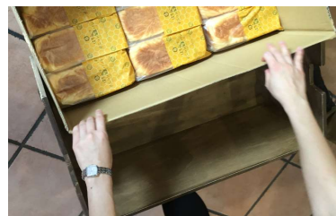
安全性、機能性を考えたパンの ストックを段ボールごと入るス トックケース