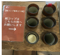
コップの形にすることで 見た目よし、ゴミ袋削減